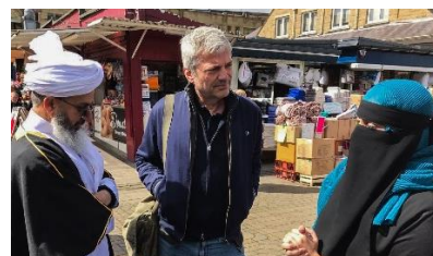
Op de markt van Dewsbury