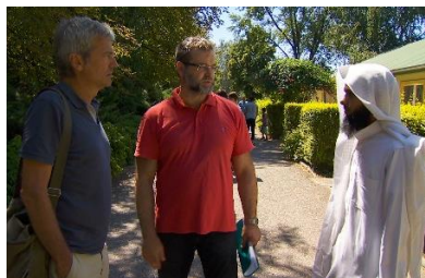
Met Arabische sjeik op jeugd kamp