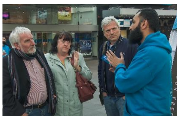
Discussie op Leicester Square