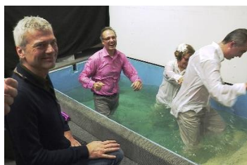
Jan bij massadoop van moslims