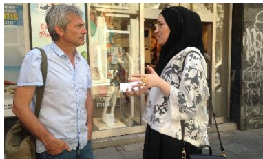
In gesprek met modeontwerpster