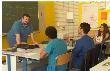
Islamonderwijs in Weense school