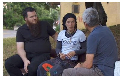
Jan met bekeerd hippiekoppel