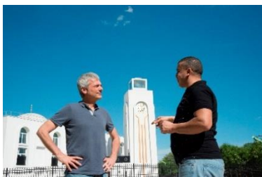
De moskee van Aulnay-sous-Bois