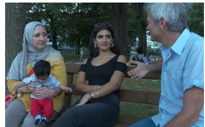
Arabische toeristen in Zell am See