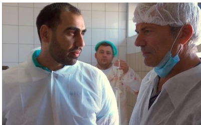
In een halal slachthuis in Hongarije

Het vakantieoord Zell am See wordt iedere zomer overspoeld door rijke Arabische toeristen uit de Golfstaten. Jan gaat poolshoogte nemen bij Oostenrijkse inwoners en toeristen.