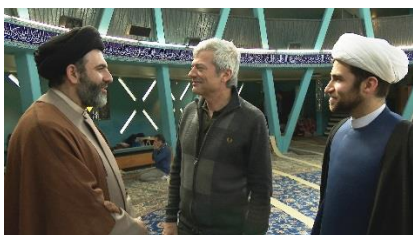
Met Sjiitische geestelijken in Hamburg