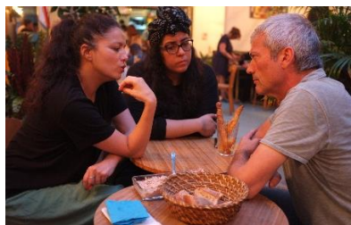
Met moslimactivistes in Parijs